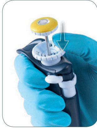
向下按拇指旋轮锁定