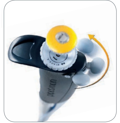
选择可调式弹射器按钮的位置 然后开始移液