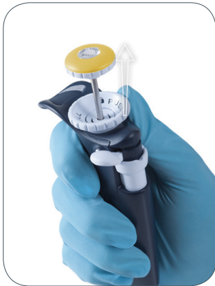
向上轻推拇指旋轮